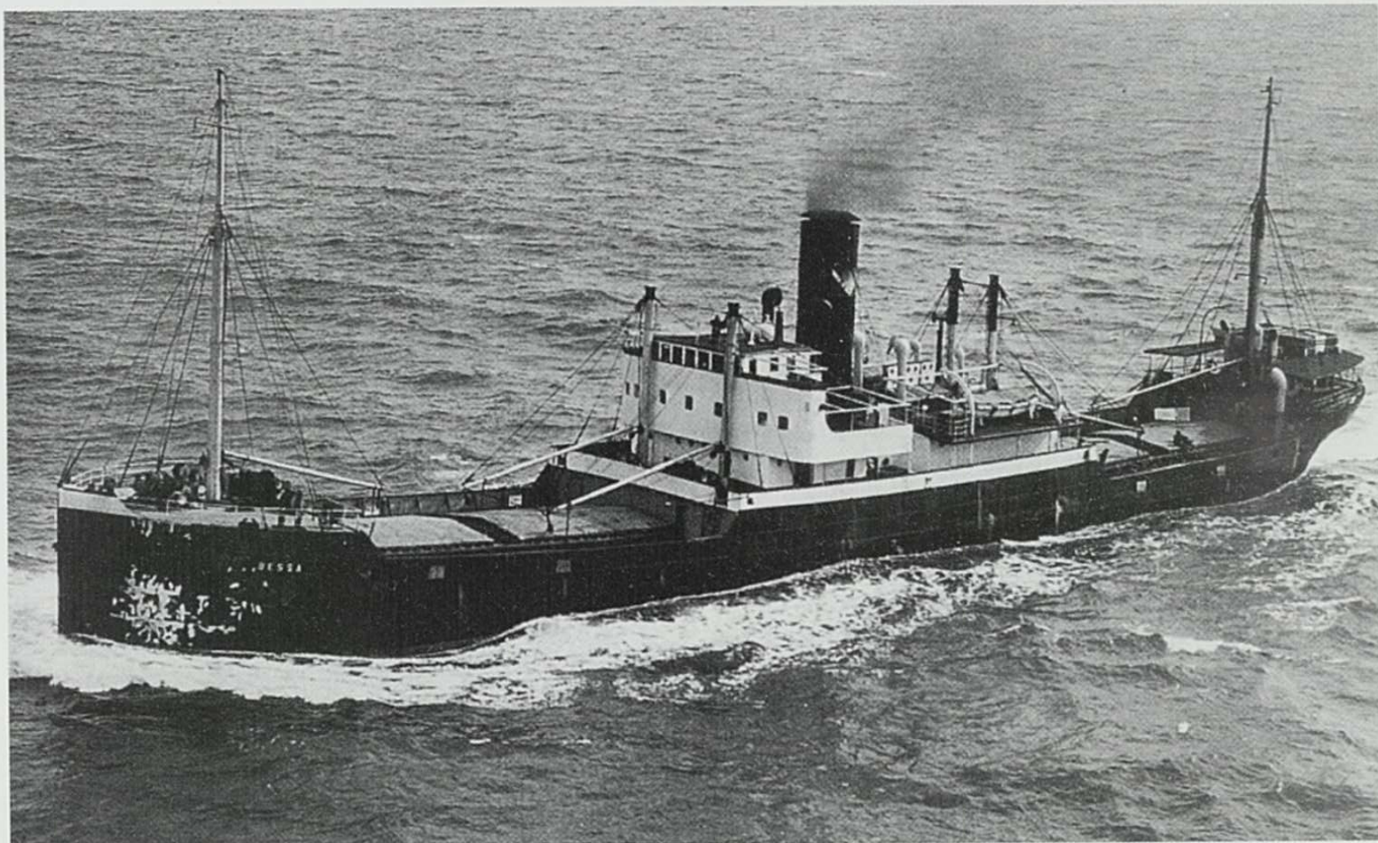
Ada (som Bessa)